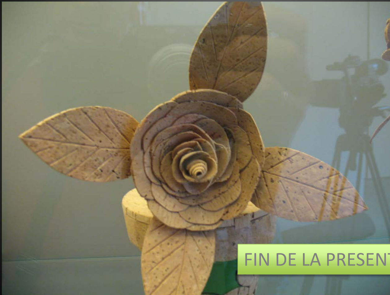
Imagen del Museo del Corcho (San Vicente de Alcántara)