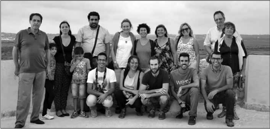
En la torre Vigía de Isla Canela (Ayamonte)

Finalmente, pudimos subir a la Torre de Vigilancia de Isla Canela, desde donde la vista de las marismas y de las poblaciones de los alrededores supone hoy un espectáculo sobrecogedor, tan lleno de sosiego como en su día lo sería de zozobra por los enfrentamientos que ambos países (España y Portugal).