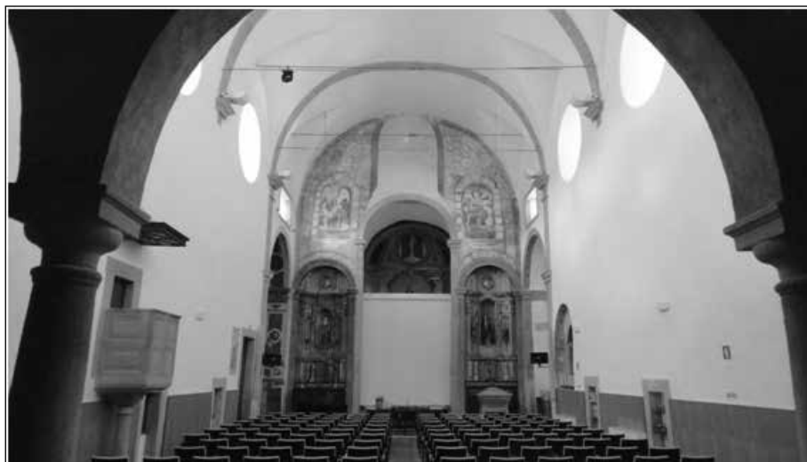
Salón de celebración de las Jornadas