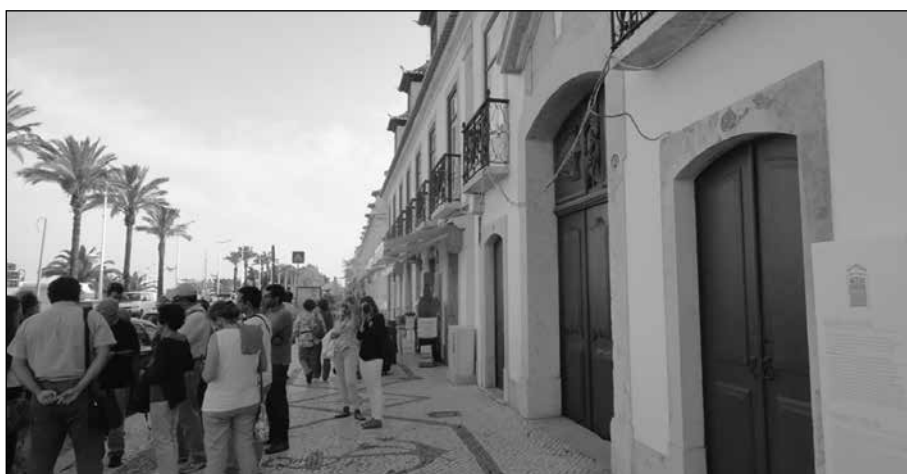
Recorrido por la zona pombalina de Vila Real de Santo António

A continuación, se tuvo la oportunidad de recorrer la “ciudad pombalina” de Vila Real de Santo António, y admirar las fachadas de su paseo fluvial, armónico conjunto, como su propia plaza principal.