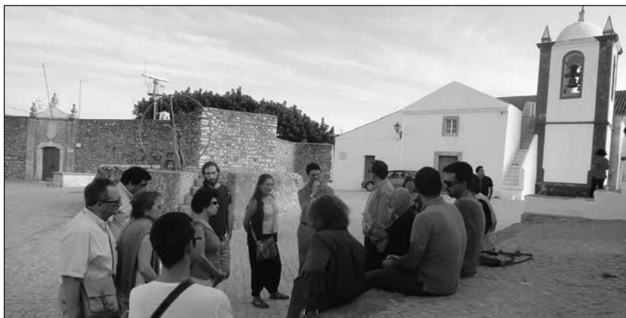
Visita al Forte de Cacela Velha

En la tarde del día 27 se visitó Cacela Velha (del municipio de Vila Real de Santo António), que posee un interesante Fuerte atenazado hacia el mar, actualmente en uso por la Guardia Nacional Republicana, para labores de vigilancia costera.