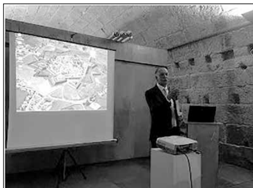
Acto de clausura. Intervención del Presidente de Câmara Municipal de Almeida.