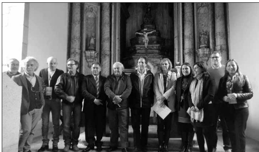
Ponentes de las jornadas de la Capilla del Forte de S. Francisco, Chaves