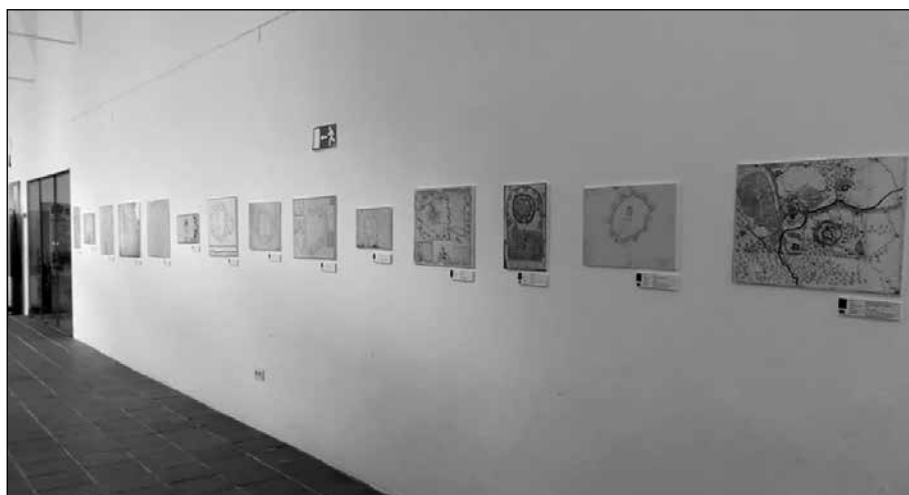
Muestra cartográfica con 18 planos que recogen la evolución de la fortificación de Olivenza desde sus inicios a nuestros días.

Como complemento a esta sesión que ocupó toda la mañana los asistentes pudieron disfrutar de dos magníficas exposiciones: