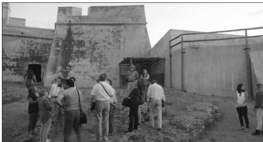
Visitando las fortificaciones de Castro Marim

Se completaron las Jornadas con visitas guiadas en las tardes de ambos días, recorriéndose en la primera todo el conjunto amurallado de Castro Marim: tanto el castillo medieval -posteriormente artillado- como los lienzos fortificados “a la moderna” y el Forte de São Sebastião.