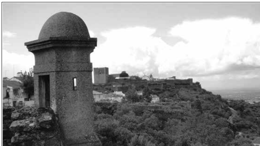
Fortificaciones de Castelo de Vide