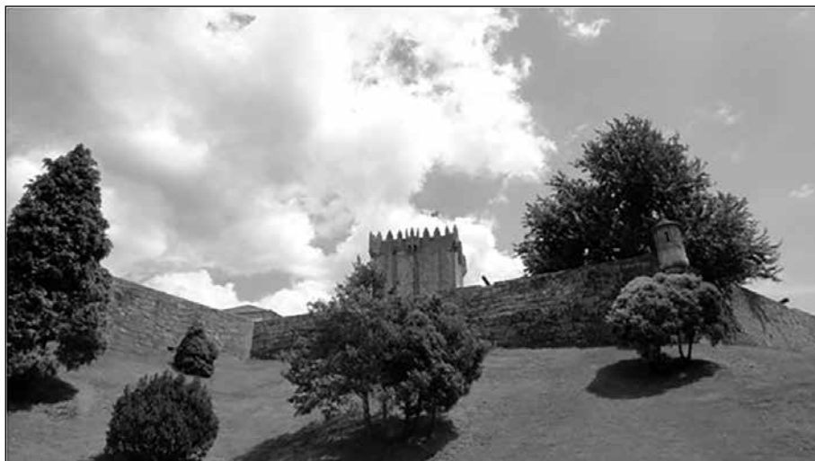
Castillo y fortificación de Chaves

De esta forma, quedaba cubierto un marco teórico y otro práctico con respecto al tratamiento de las fortificaciones, especialmente en el entorno comprendido por la zona del río Miño, Tras-os-Montes, Beira fronteriza y Raya salmantina.