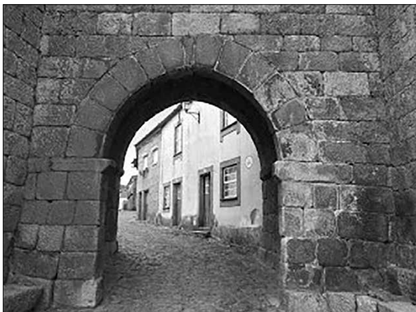
Entrada a Castelo Mendo

Posteriormente, durante el día 30 de abril, se realizó una visita a diversos lugares de la fortaleza de Almeida, especialmente a su Museu Histórico-Militar, así como a otros lugares patrimoniales de los alrededores, entre los que debemos destacar la freguesía de Malhada Sorda (donde se inauguró una “esnoga” -sinagoga de culto “discreto” de los judíos expulsados de España por los Reyes Católicos y acogidos en la zona-, habilitada ahora como local cultural), en que actuó su Banda Filarmónica, y se recorrió la ciudad medieval fortificada de Castelo Mendo.